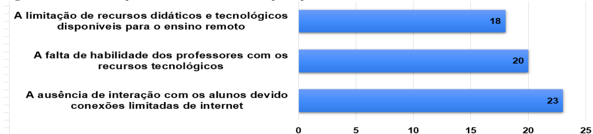
Figura 3 – Dificuldades para realizar o ensino remoto pelos professores de Matemática

Apresenta-se, a seguir, a Figura 3, que mostra as principais dificuldades encontradas pelos professores de Matemática para realizar o trabalho de forma remota durante o período da pandemia, na percepção dos participantes do Programa Residência Pedagógica.