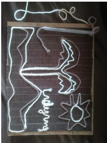
Figura 1 - Recurso didático: caneta maluca