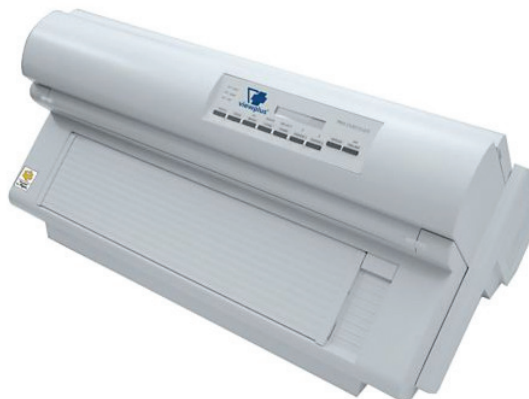
Figura 2 - Impressora Tiger Pro Embosser

na educação de pessoas cegas como um instrumento de lazer, oferecendo-lhes acesso à arte e a cultura, constituindo mais um modo de interação da pessoa cega com o ambiente.