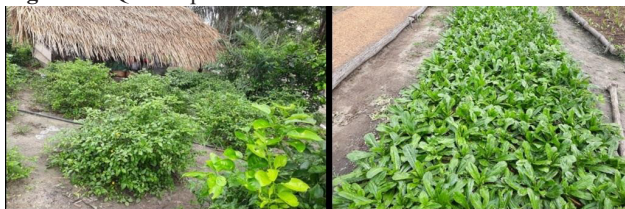
Figura 2 - Quintal produtivo no bairro