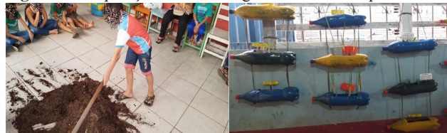
Figura 3 - Preparação de adubo orgânico e Horta suspensa