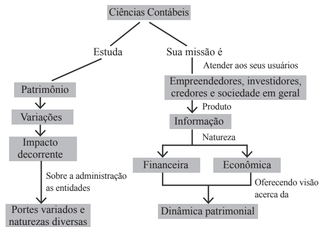
Figura 3: Exemplo de mapa conceitual