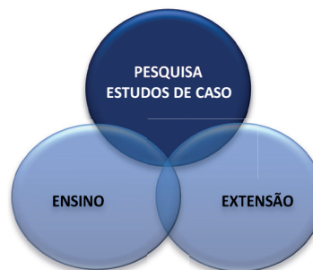
Figura 2: Articulação das dimensões ensino, pesquisa e extensão na prática de estudo de caso

Um único case tem o potencial de viabilizar diferentes abordagens inéditas de construção, todas igualmente relevantes e contributivas.