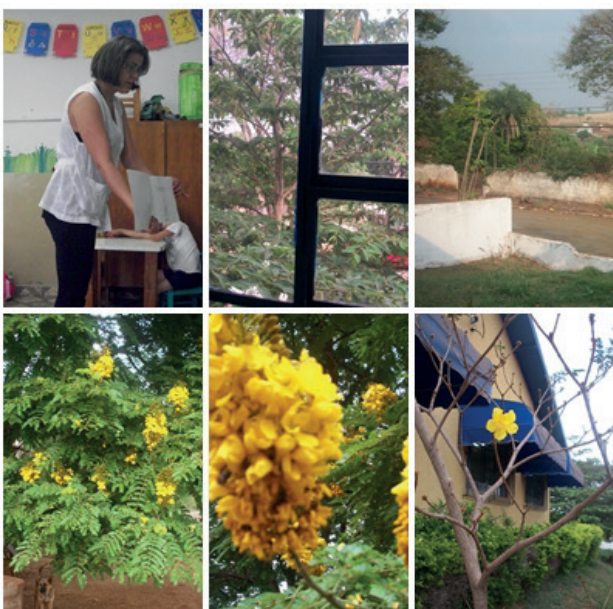
Figura 2: A flor amarela