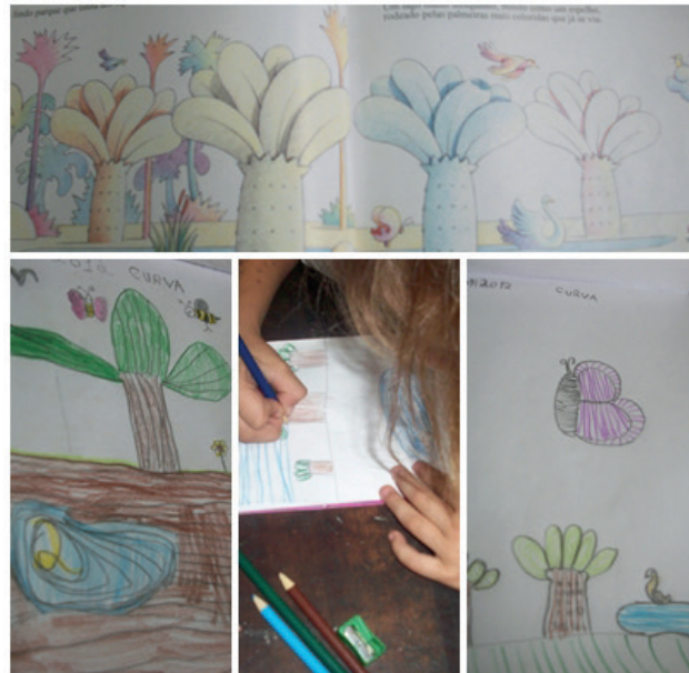
Figura 3: Produção dos alunos: linha, curva e a flor amarela

Após, a aula de campo, foi produzido com os alunos um trabalho prático, no qual os alunos que participaram da aula de desenho criativo ilustraram a atividade, e foi introduzido o conceito histórico sobre a técnica (linha e curva).