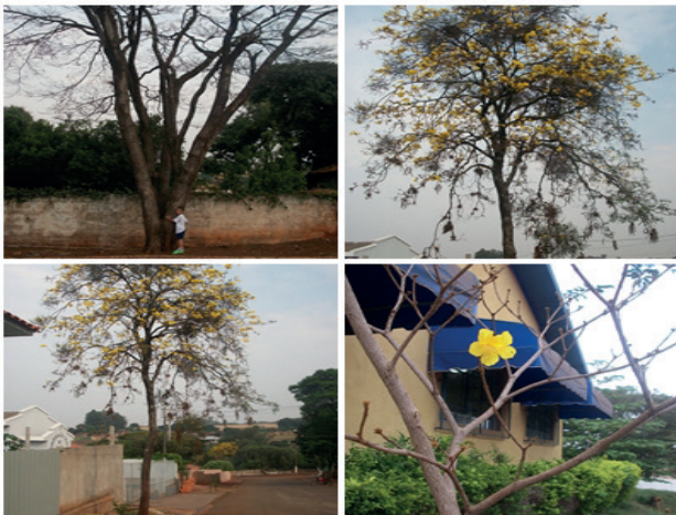
Figura 1: Arredores da escola

Em seguida, promoveu-se um debate sobre a temática e contribuições de cada aluno, conforme suas experiências individuais. A experiência de observação do entorno individual e coletivo culminou na análise comparativa da história com a natureza ao seu redor e o manuseio do livro por parte de cada aluno. Cada aluno pode, neste momento do projeto, entrar em contato com esta forma de comunicação, de forma que este livro foi folheado e observado, de uma forma sistemática, após o levantamento do professor. A próxima etapa culminou em uma aula passeio, pela comunidade estabelecendo relação entre a leitura realizada, observação da fala dos alunos, levantando a característica que mais chamou atenção.