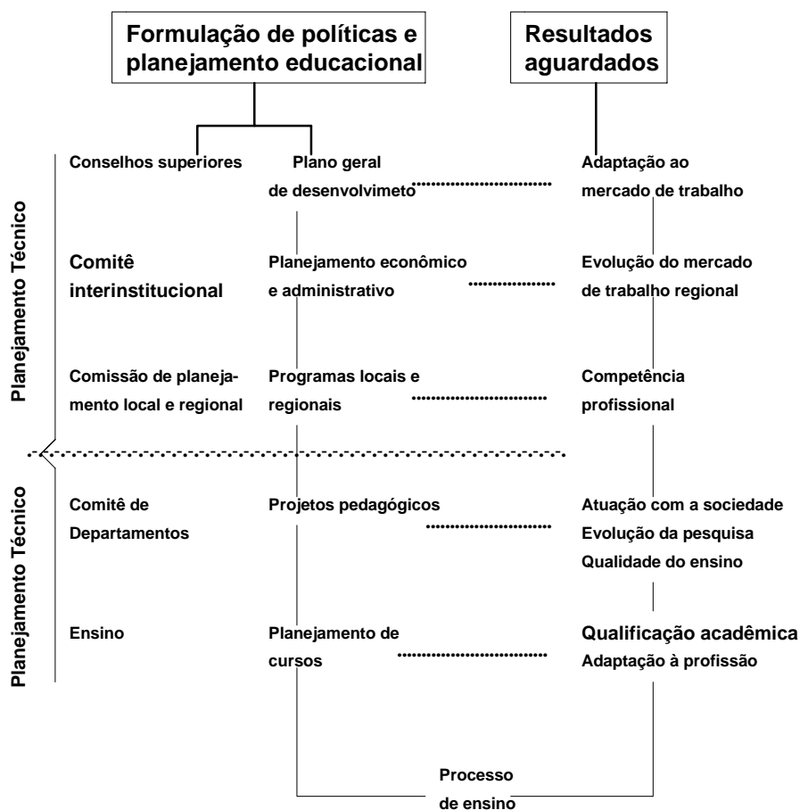
Figura 1 – Política e planejamento educacional.

No entanto, convém destacar que a política educacional se encaminha mediante certos pressupostos. Primeiramente, torna-se indispensável que realmente haja uma política educacional consensual. Por outro, necessita ela estar vincada em bases sólidas, em que os dados da realidade interna e externa da Instituição sejam o reflexo fiel de uma análise consistente.