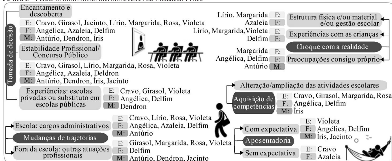
Figura 3 - Percurso profissional dos professores de Educação Física

Legenda: E= Estadual; F= Federal e M= Municipal.