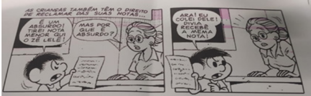
Figura 6 - Tirinha sobre o tema autogestão produzida por aluno