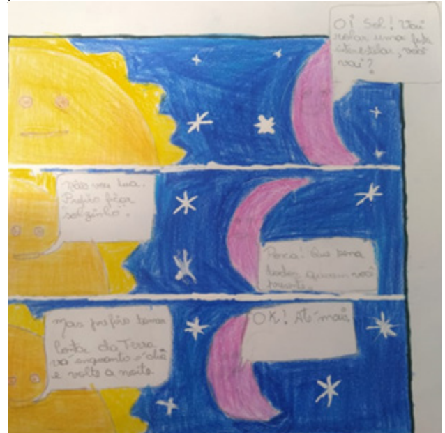
Figura 9 - Tirinha sobre o tema autonomia e empatia produzida por aluno