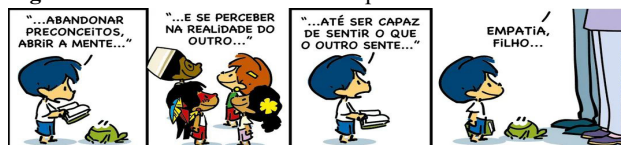
Figura 4- Precisamos falar sobre empatia