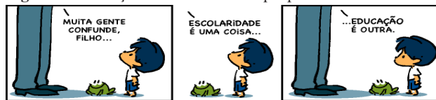
Figura 3- Educação é muito mais do que pensar