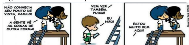
Figura 2 - Tirinha sobre empatia

enquanto pessoa e; por último, teceram aspectos relativos à pandemia em que iv) as competências socioemocionais podem ajudar os alunos a enfrentarem melhor o período de pandemia, que tem afetado muito suas mentes e seus estudos. Em seguida, como estratégia metodológica foi proposto que os estudantes debatêssem sobre os possíveis caminhos para solução do problema. Ao pensarem nas questões levantadas a partir da leitura conjunta do texto, bem como aquelas discutidas na roda de conversa inicial, para esse segundo momento propôs-se aos estudantes a realização da leitura das seguintes Tirinhas do Armandinho de autoria do ilustrador catarinense Alexandre Beck, expostas nas Figuras de 2 a 4.