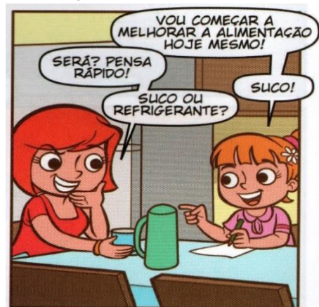
Figura 3 – Fragmento de uma HQ Turma do Planeta Azul

As HQ, além de proporcionar o prazer e entretenimento, constituem uma fascinante demonstração da criatividade humana. A forma e a estrutura desta arte narrativa mostram ao aluno a vivacidade do discurso direto presente nas histórias, esta vivacidade é provocada sobretudo pela variedade de expressões, de dicções e de termos que entram em sua composição.