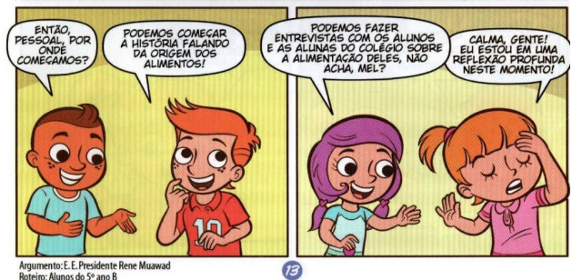
Figura 2 – Fragmento de uma HQ Turma do Planeta Azul

e uma diversidade de temas presentes no contexto social. Estes aspectos fortalecem o ensino e contribui para a produção textual e a formação do leitor, pois está associada com a forma de entendimento das crianças facilitando a compreensão, fatores que tornam a leitura atrativa e prazerosa, despertando o gosto pela prática e a internalização de novos conhecimentos. Para isso, a metodologia do Projeto Planeta Azul contempla, além da leitura, atividades como pensamento da semana, livro da aprendizagem, roda da leitura e elaboração e publicação dos roteiros para HQs.