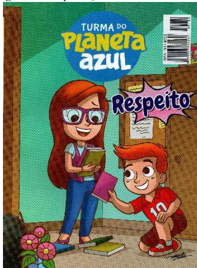
Figura 1 – Capa HQ Turma do Planeta Azul

Atualmente, a revista Turma do Planeta Azul publicada pela fundação em formato de história em quadrinhos circula, especialmente nas escolas. Cada edição é composta por argumentos de histórias vividas pelos alunos, em sala de aula, em suas famílias e/ou na sociedade e adaptadas aos personagens da HQ. As histórias abordam temas como: cidadania, preservação do meio ambiente, respeito, limpeza e organização, alimentação saudável, entre outros.