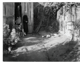
Figura 6: Fotografia de família não identificada n° I-5-2-1-6-104 (frente)

A fotografia da Figura 6 (frente e verso) também é de autoria desconhecida. Embora não apresente a figura masculina, pode-se entender essa fotografia como de família. Alguns indícios possibilitam compreendê-la dessa forma, principalmente pelo que há escrito em seu verso (está em alemão, porém a palavra “família” está bem nítida). Essa imagem difere das outras pelo ambiente, em que se destaca uma família humilde. Observam-se duas mulheres, uma bem mais velha que a outra, e crianças sentadas à porta da casa. Essa fotografia parece ter sido tirada com a intenção de mostrar também o quintal com as criações (patos e galinhas) e vegetação (parreira de chuchu, jardim). A casa de madeira era bem comum nessa época, principalmente entre os colonos e seus descendentes. As roupas escuras nos adultos e claras nas crianças continuam a caracterizar esse período.