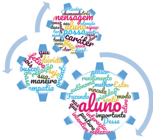
Figura 2 - Tríade na engrenagem da mediação

Para cada resposta obtida foi criado um World Cloud , a fim de identificar as palavras que mais se evidenciaram nas justificativas encaminhadas que se relacionam com a tríade da mediação, a Figura 2 aborda na engrenagem da mediação as três respostas.