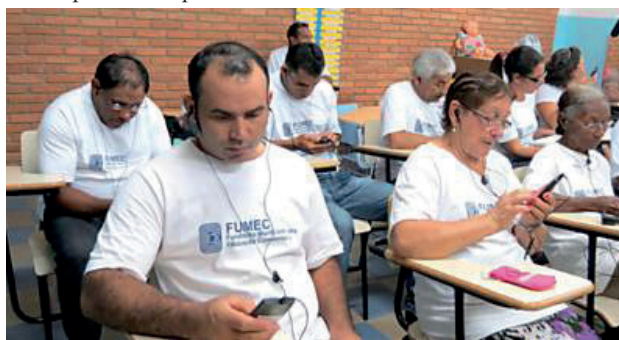
Figura 1 - Jovens e adultos usando o Palma em uma escola municipal de Campinas