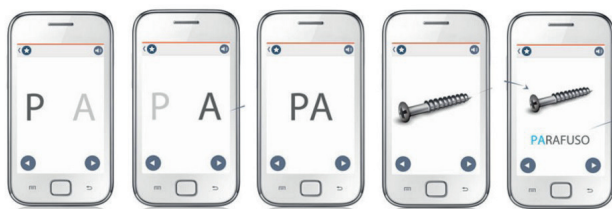
Figura 2 - Exemplo de Atividade