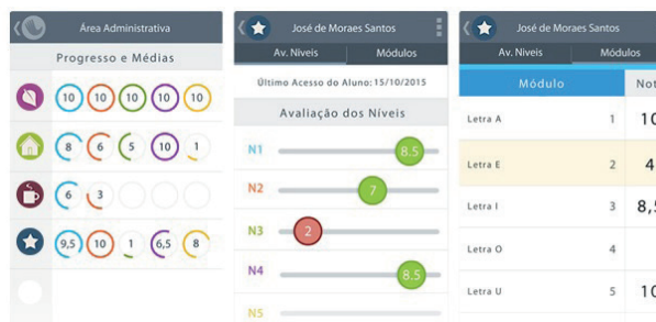
Figura 7 - Áreas administrativas e avaliação

Fonte: Guia de Orientações Didáticas – Palma PRO, 2014.