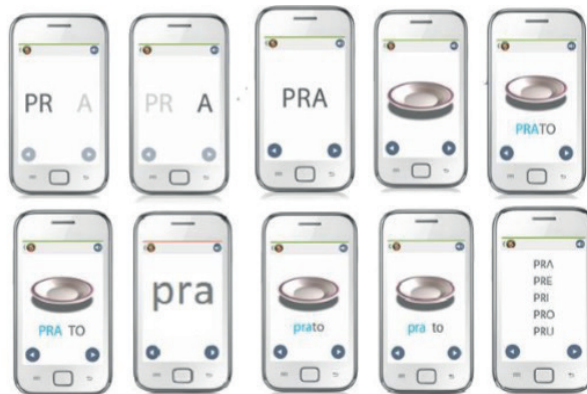
Figura 6 - Consoante + Consoante + Vogal, Atividade de Aprendizagem

Fonte: Guia de Orientações Didáticas – Palma PRO (2014).