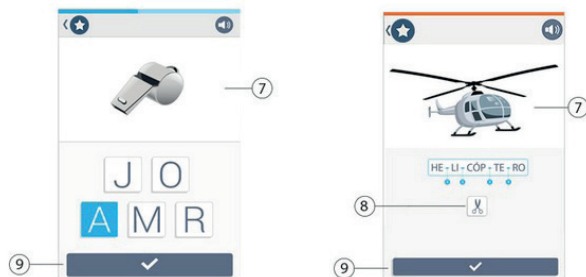
Figura 5 - Componentes do Design Palma Escola

função de áudio ao clicar sobre essas. A tesoura, número 8, para o corte da letra ou sílaba na atividade. O botão 9 é o verificar, que confirma a resposta e avança para a próxima atividade, esses são exemplos utilizados pelo aplicativo, por exemplo.