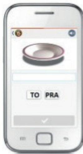
Figura 3 - Exemplo de ensino da palavra “PRATO” no aplicativo através do uso de figuras (representação gráfica)