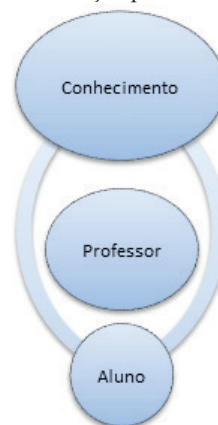
Figura 1 - Interação professor e aluno

O ensino tradicional ou presencial é o sistema mais antigo envolvido na transmissão de conhecimentos, pois se baseia em três elementos: o aluno, o estudo e o mestre, sendo que o docente terá seu conhecimento repassado como fonte principal para o aluno que será o receptor, de acordo com o método e técnicas para absorção de conhecimento ou objeto do estudo. Atualmente, o docente é visto como um intermediador, responsável pela interface aluno - objeto de estudo, porém é atribuída ao aluno a necessidade de buscar aprimoramento constante, baseado em sua percepção do meio em que vive, de sua escrita e, também, de sua oratória para que seja materializado este conhecimento.