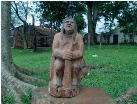
Figura 6 - Nheçu – Líder indígena Guarani

indígena presente um físico forte e domina a serpente, ele não traz identidade. Está demonstrado na nudez. É, ao mesmo tempo, um vencedor, porém vencido pelo apagamento de sua identidade.