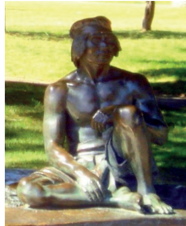
Figura 7 - Estátua uruguiaia

conforme o europeu está sempre representado. Um paradoxo construído de fortaleza e apatia. O corpo desenhado pelos músculos e a lassidão das mãos demonstram este constraste. Continua seminu, conforme outros monumentos de nativos, o que dá uma homogeneidade de etnia, porque nada o identifica como de determinada comunidade (índice), com exceção da legenda.