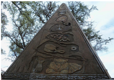
Figura 2 - Monumento a Benito Quinquela Martin

As pirâmides antigas foram construídas a partir do barro, pedra e materiais sempre extraídos recursos naturais mais próximos possíveis para a sua estruturação. Há, para explicá-las, muita literatura em diferentes abordagens. Assim, na abordagem da leitura semiótica, a pirâmide é ícone de estrutura/perfil de um povo. Monumento que está muito próximo –como leitura oficial – dos nativos locais.