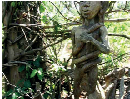
Figura 4 - Kurupi. Mitología Guaranítica del grupo “Katupyry” (“habilidoso”, en guaraní).

cobra: ser telúrico que sabe o segredo da morte e do tempo, porque sai de dentro da terra e controla a vida que sempre se renova. Assim, segundo Durand (1997), é símbolo das origens da vida.