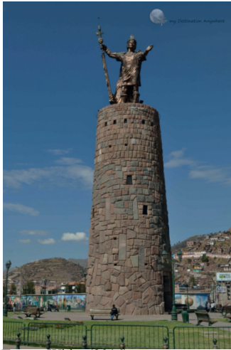
Figura 8 - Monumento Inca Pachacuti