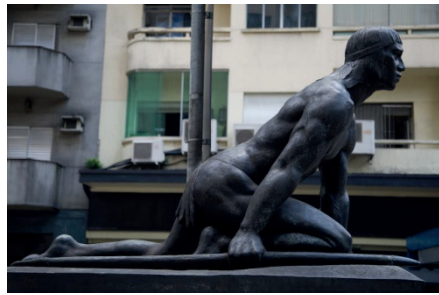
Figura 9 - Índio em posição de caça

Os povos nativos exercem influência até hoje nas práticas religiosas, gastronomia, conhecimento da fauna e da flora. São os principais: Guaranis, Tucunas, Caingangue, Macuxi, Terena, Guajajara, Ianomami, Xavante, Pataxó, Potiguiara.