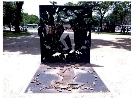
Figura 10 - Índio Galdino

Ícone de homem primordial americano, mas sem identificação de etnia, o representante do nativo brasileiro, no monumento, é símbolo de força física, tanto pela estrutura corporal quanto pela linguagem do corpo que comporta o sentido de autodefesa. Como índice de ameaça, apesar de estar abaixado, quase como um felino, está em posição de ataque, combate, situação reforçada pela zagaia de defesa ou ataque em sua mão. Todo ele é símbolo de resistência.