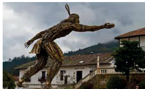
Figura 1 - Monumento criado pelos homens

Embora a postura seja um amálgama, retrato da dominação ocorrida na América do Sul, o artista criou um homem muito forte fisicamente. Assim, deixa claro que a dominação foi política a um povo que era harmônico, saudável e solidário.