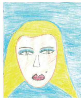
Figura 3: Reprodução 2

As imagens abaixo são aquelas que foram reproduzidas com algumas discrepâncias do texto proposto.