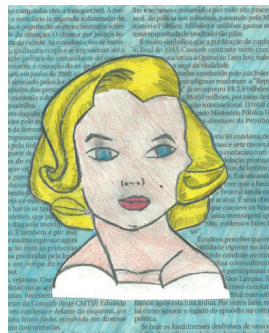
Figura 7: Reprodução 6

O retrato que esse aluno fez também obedeceu à descrição demonstrando assim uma leitura atenta do texto. Detalhes como o olhar “mortal e sensual” (analogias) foram retratados por ele, bem como o formato das sobrancelhas que “seguia o desenho dos olhos” foram representados de forma precisa. Apesar do efeito de luz e sombra não ter sido reportado no texto descritivo, ele o transpôs para o seu texto ao reproduzir o retrato.