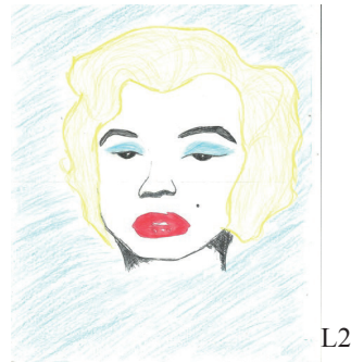
Figura 6: Reprodução 5

É possível perceber que a aluna leu atentamente o texto descritivo postado no grupo, pois ela se atentou a detalhes como a cor da sombra sobre os olhos, o formato da boca, a maneira como ela está aberta e detalhes como o comprimento e o penteado do cabelo e o azul que estava no fundo, elementos presentes na fragmentação e relações de analogias.