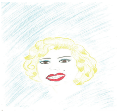
Figura 5: Reprodução 4

Três ilustrações foram as que foram mais fiéis ao texto descrito e postado no grupo do whatsApp . O primeiro desses: