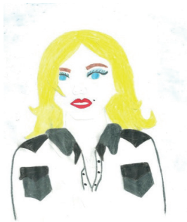
Figura 4: Reprodução 3