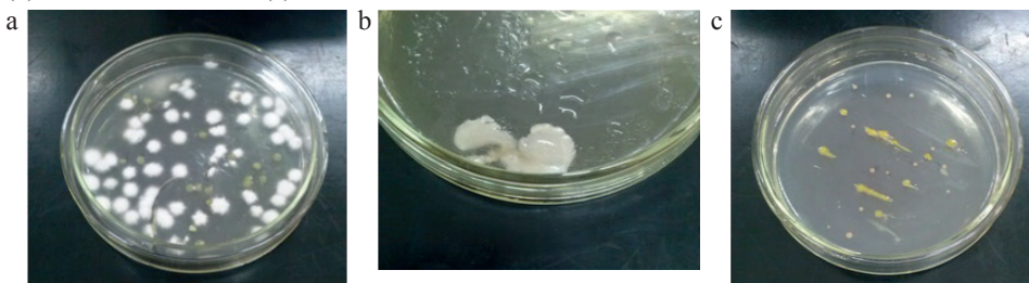
Figura 2: Evidências de crescimento bacteriano nas placas incubadas: (a) Contato das mãos sujas; (b) Contato com caneta; (c) Contato com saliva

No experimento, após a construção das placas de Petri e análise dos resultados, foi possível constatar que houve crescimento microbiano. As observações foram feitas a olho nu, mostrando aos alunos a formação de colônias a partir de amostras coletadas em suas próprias mãos, no ambiente escolar e na saliva de alguns alunos (Figura 2).