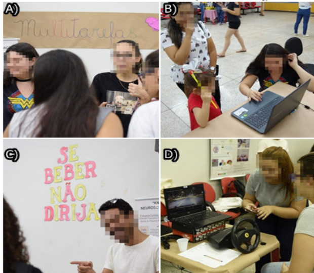
Figura 1 - A) Participação dos alunos de Ensino Médio no estande de “Multitarefas”; B) monitora do estande de “Multitarefa” adaptando a linguagem do vídeo utilizado para explicar os conceitos para uma criança; C) monitora explicando os conceitos apresentados no estande “Se beber não dirija” e D) visitante no estande realizando a dinâmica de simulação de embriaguez.

apontar após a primeira roldana girar, se para a ovelha ou para o porco. Visto que a execução desta tarefa poderia ser de difícil entendimento para certos visitantes, assim como em outras atividades propostas, adaptava-se a linguagem e a atividade de acordo com a faixa-etária.