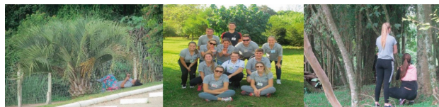
Figura 3 – Registros fotográficos das atividades O que me toca, Pirâmide da Vida e Encontre a Árvore .