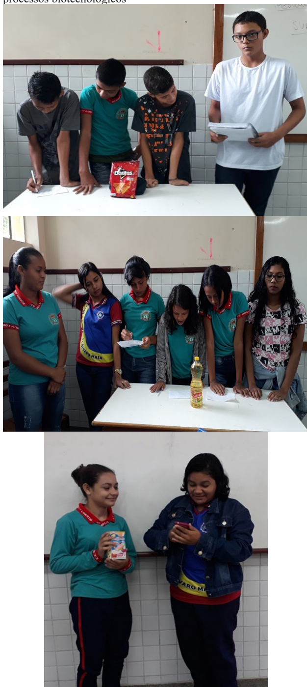
Figura 2A, 2B, 2C - Apresentação dos alimentos derivados de processos biotecnológicos