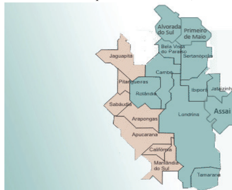
Figura 1: Região Metropolitana de Londrina (RML) consolidada e em processo de adesão, 2011

A Região Metropolitana de Londrina (RML) foi constituída com a missão de promover a integração regional, articulando as políticas públicas de interesse comum entre os municípios e o Estado. A Lei Complementar Estadual nº 81, de 17 de junho de 1998, instituiu a região formada pelos Municípios de Londrina, Cambé, Rolândia, Ibiporã, Sertãozinho, Bela Vista do Paraíso, Jataizinho, Primeiro de Maio, Assaí, Alvorada do Sul e Tamarana conforme Figura 1, totalizando 801.756 habitantes (IBGE, 2010; COMEL, 2011).