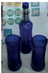
C – Copos de vidro.