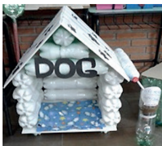
A – Casinha de cachorro com calha e filtro d'água.