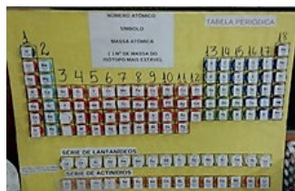
D – Tabela periódica de isopor e tampinhas de garrafa.