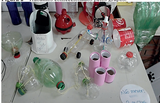
Figura 2 - Trabalhos confeccionados pelos grupos.

Vários outros trabalhos foram desenvolvidos e apresentados pelos alunos à escola e à comunidade em geral. Carrinho, brinquedos, vassoura, porta sabonete, abajur, dentre outros que foram confeccionados pelos alunos, a fim de que se pudesse perceber que os materiais podem ser reciclados e que nem tudo é descartável, com um pouco de criatividade, dedicação e desempenho, estes podem ser transformados em objetos que trazem, quando bem explorados, uma rentabilidade viável para a sociedade e, principalmente, um cuidado especial com o Meio Ambiente, uma vez que a grande maioria dos objetos produzidos pelos alunos é feita a base de plásticos, os quais demoram anos para serem decompostos pelo ambiente, sendo exposto na Figura 2 novos produtos.