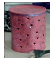
E – Luminária de lata de milho.