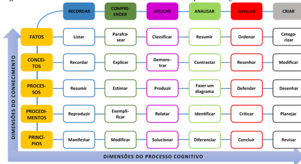
Figura 2 - Interfaces entre as dimensões do conhecimento e do processo cognitivo

Inicialmente, é necessário considerar que diferentes categorias de conteúdos cognitivos geram processos diversos síntese/criação, como se depreende da Figura 2. Por exemplo, dados e fatos são sintetizados mediante categorizações; conceitos e princípios, mediante textos discursivos/argumentativos; processos e procedimentos, mediante desenho de fluxos ou infográficos. Na prática, ao sintetizar é mais comum a adoção de textos discursivos/argumentativos, talvez, por desconhecimento dessas diferentes possibilidades ou, ainda, porque os componentes curriculares na Pedagogia privilegiam o estudo de princípios e conceitos. No entanto, é possível utilizar dois ou mais desses processos sintéticos em uma única síntese.