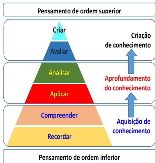
Figura 3 - Funções dos níveis cognitivos

Ainda, de acordo com esse autor, em um congresso da Cisco, em 2007, com o tema “Educação 3.0” Michel Stevenson apresentou o fluxo cognitivo em três etapas, representado à direita na Figura 3, e criado pelo Dr. Michael Stevenson. No esquema da figura, vê-se que as operações cognitivas de ordem inferior permitem, ao indivíduo, a aquisição do conhecimento; as operações cognitivas de ordem intermediária possibilitam o aprofundamento do conhecimento; as operações de ordem superior visam criação do conhecimento. Do ponto de vista dos autores, mesmo nas universidades, os estudantes são incentivados a aprofundar, mas, menos frequentemente, a (re) criar conhecimento. Vê-se, em decorrência, a importância da síntese como uma estratégia de criação do conhecimento e, sobretudo, de desenvolvimento da pessoa.