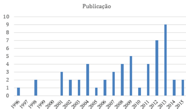
Figura 1: Número de publicações que tratam do tema “experimentação” entre 1996 e 2015