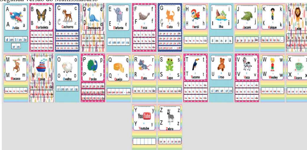
Figura 2 – Segunda versão do Multissilabário

A segunda versão, Figura 2, manteve as etapas de apresentação, no entanto o layout de apresentação foi mais elaborado, tendo em vista que envolveu uma organização visual das sílabas e de imagens correspondentes aos grafemas e aos fonemas trabalhados. Ademais, houve também a criação de um cartaz indicativo de quais grafemas apresentavam fonemas semelhantes ou iguais, além de situações ortográficas específicas.