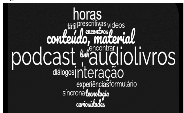
Figura 2 - Pontos a serem melhorados

Compondo a última etapa do questionário de avaliação geral do curso, o cursista foi convidado a responder sobre os pontos a serem melhorados durante a formação apresentada. Esse questionamento visa o aprimoramento de estudos futuros. Seguindo com a mesma metodologia de análise e interpretação dos dados, abordaremos uma nuvem de palavras, Figura 2, com análise do conteúdo das 26 respostas apresentadas.