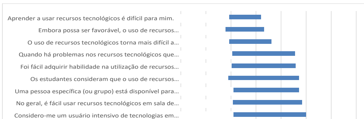
Figura 5 – Percepção de uso de recursos tecnológicos pelos professores

A seguir, apresentam-se assertivas relacionadas à percepção dos professores quanto ao uso de recursos tecnológicos no curso de graduação em Ciências Contábeis. Ressalta-se que os recursos tecnológicos aqui considerados são aqueles que foram apontados na segunda parte do instrumento de pesquisa respondido pelos professores que ministram aulas atualmente no curso de Ciências Contábeis da instituição, objeto da pesquisa, com nível de intensidade de uso “muito alto”.